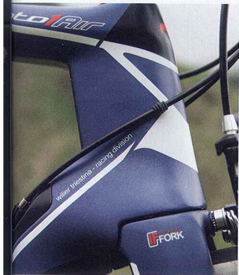
de balhoofdbuis en een nauwsluitende voorvork.

beeld heeft gedaan. Maar eigenlijk is het ook wel weer logisch: zoals Wilier de Air nu brengt, is het frame compatibel met alle onderdelengroepen. En het is ook nog eens een plaatje van een fiets. Los kost hij 2899 euro, compleet rond de 5200 euro. Als dit je budget te boven gaat, dan is er ook een complete fiets met Ultegra of Force voor 3899 euro.